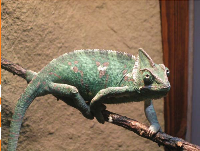
Zx foto internet

„Tohle zvíře si opravdu nekupuj, je špatné, zákeřné a má zlou povahu...“ A tak dále, a tak dále... Pověst chameleonů je opředená mnoha báchorkami a pověstmi. Tak jako tak, chov takového miláčka vyžaduje zkušeného chovatele.